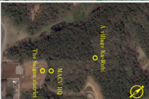
The first area in Sa-Wan South Vietnam 1968